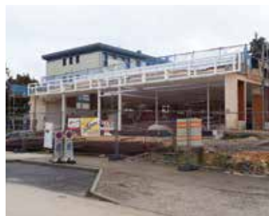
Un châssis métallique sur la devanture

Le chantier a bien avancé depuis son lancement en janvier dernier. La démolition et le curetage ainsi que le désamiantage complet du site sont désormais terminés.