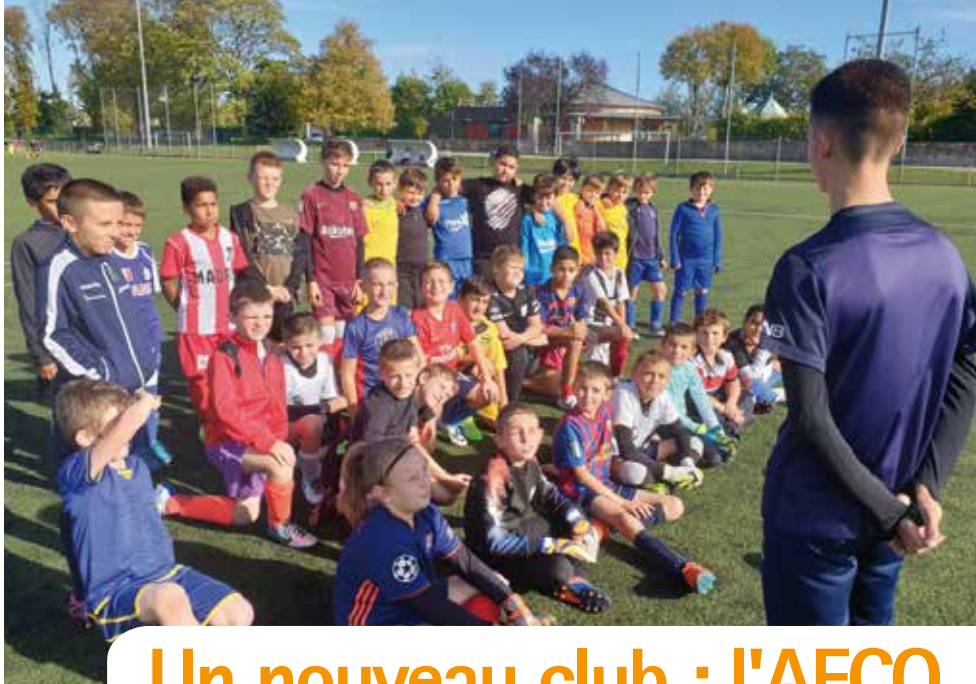
Jour d'entraînement pour les U11