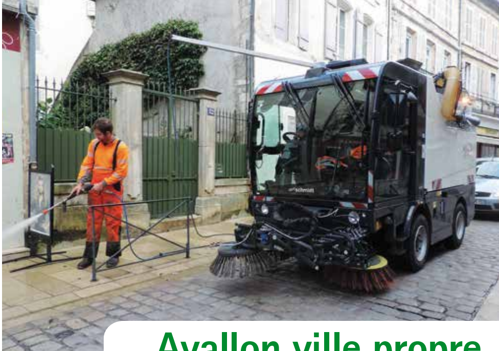
Nettoyage des trottoirs de la Grande rue