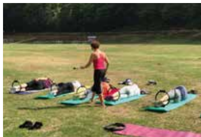
Un peu de détente avec la gym / pilates

infrastructures permanentes : mini-golf, baby-foot, escalade, tennis de table et badminton.