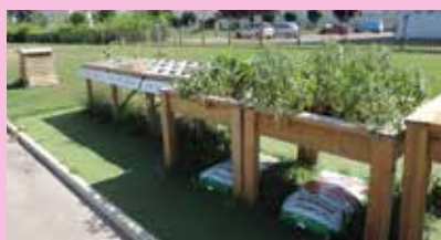
Le potager de l'école Victor Hugo