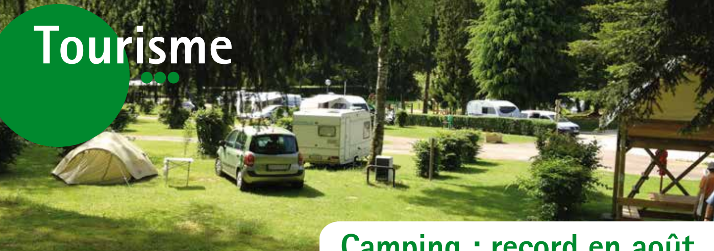
Le camping, un lieu reposant dans un écrin de verdure