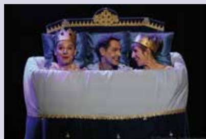
La belle histoire de Cendrillon

- Dimanche 8 à 10h30 , au cinéma Le Vauban (rue Maréchal Foch). Dans le cadre du programme Cin'espigle, un court métrage de 40 mn « Pat et Mat en hiver » est proposé aux petits à partir de 3 ans, au tarif unique de 4 €.