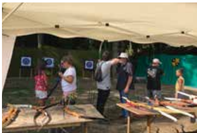
Petite séance de tir à l'arc

Les activités proposées étaient accessibles à tous. Il y en avait pour tous les goûts, tous les âges mais aussi pour toutes les bourses puisque la majorité des animations étaient gratuites.