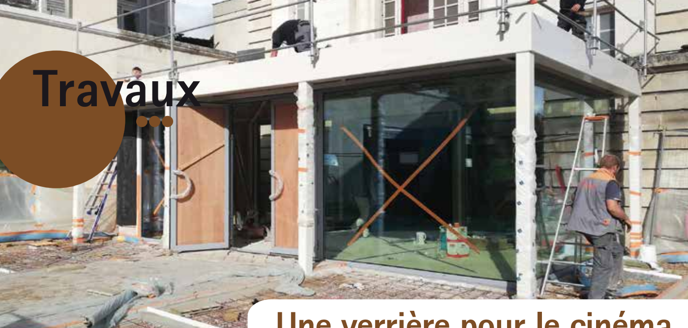
Les vitres ont été posées sur l'extension du hall