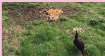
Une poule des Remparts, qui picore du lard