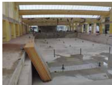
Les bassins prêts à accueillir les coques

La pataugeoire est aujourd'hui construite. Les ossatures métalliques sont posées. Les raccordements des réseaux ont été effectués. Reste à installer les châssis et les huisseries sur cette structure.