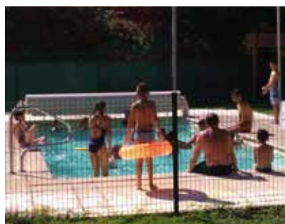
Moment de détente au bord de la piscine

Enfin, on retiendra le succès de la location des VTT à assistance électrique avec 65 demi-journées et 68 sorties pour la journée, un chiffre multiplié par trois par rapport à 2018. Ce qui accrédite l'idée que le camping Sous Roche s'adresse aussi aux adeptes des activités de pleine nature, séduits par le Morvan.