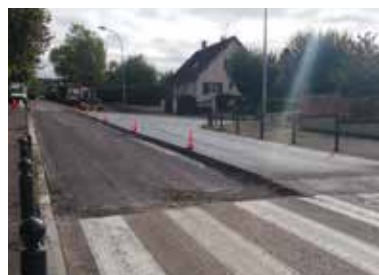
Un plateau surélevé devant l'école A.Gendre

publique organisée en 2018 durant laquelle les habitants du quartier avaient exprimé leur souhait de voir la vitesse diminuer, notamment aux abords des écoles.