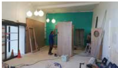
Le futur accueil / services à la population