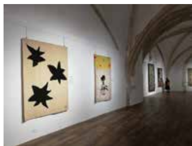
Quelques tapisseries, salle de la Fabrique

Cette année, 14 expositions d'artistes locaux, nationaux et internationaux ont été présentées, rassemblant plus de 20 000 visiteurs .