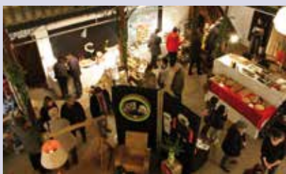
Les Mères Noël

- Du 6 au 8 et du 13 au 15 , dans une ambiance chaleureuse et conviviale, venez découvrir le travail des « Mères Noël », au Grenier à Sel et des « Pères Fêtards » à la Maison des Sires (rue Bocquillot).