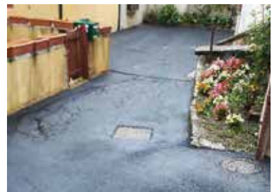
L'impasse de la Foudre refaite à neuf

En parallèle de tous ces travaux, les services techniques ont réalisé les travaux de trottoirs dans le lotissement du Pommier Rouge, celui de la Petite Corvée et dans l'impasse de la Foudre, un peu moins connue des Avallonnais. Coût en régie : 60 000 €.