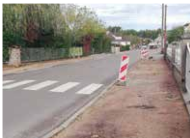
Trottoirs de la rue de la Goulotte

Sont également au programme l'abaissement des bordures et la pose d'un enrobé.